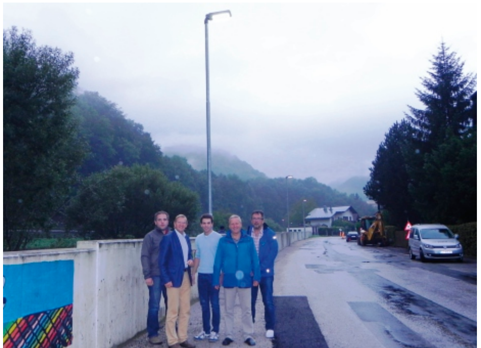
Bürgermeister und ein Teil des Teams in der Castellistraße im LED -Licht

Der sichere Schritt für Lilienfeld: Schritt und sein Team!